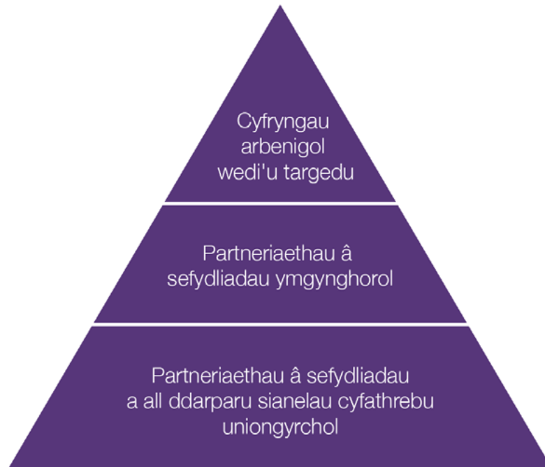
Figur 3 Sut rydym yn bwriadu ennyn diddordeb microfusnesau

Mae ein hymagwedd yn cynnwys tair elfen fel a ddisgrifir isod: